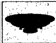
マルチピンスライダー